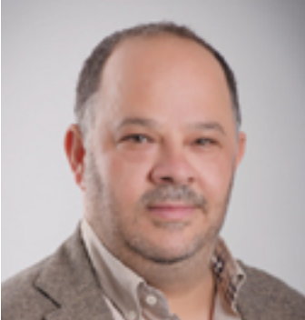
Αρχιτέκτονας, Βόλτα στην Αθήνα, Παιδείας, Πρασίνου, Περιβάλλοντος & Ποιότητας Ζωής,